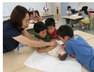
職業体験教室 (プログラミング&保育士体験)