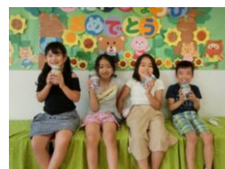
お誕生会[大地]・[大空]