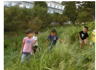
品濃中央公園にて