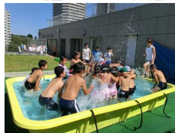
屋上庭園&プール（６階）