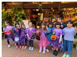
ハロウィンパーティ